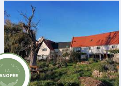
La Canopée Bondues